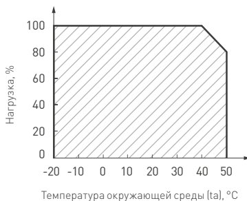
Рисунок 2. Максимальная допустимая нагрузка, % от мощности источника.